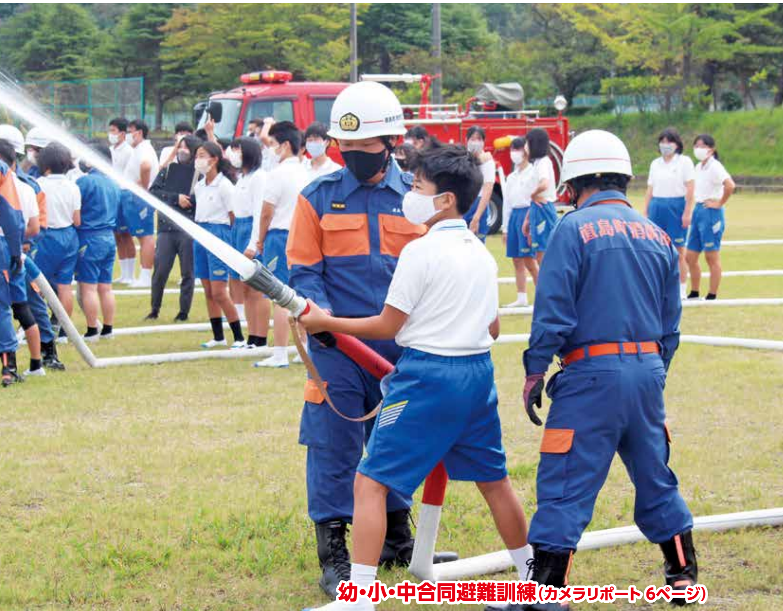
幼・小・中合同避難訓練(カメラリポート6ページ)

町の人口 | 11月1日現在(先月比) 世帯数/1,564(-8) 人口/2,981(-12) 男/1,548(-6) 女/1,433(-6) 住民基本台帳法の一部を改正する法律により、人口は、外国人の方を含めた人数となっています。