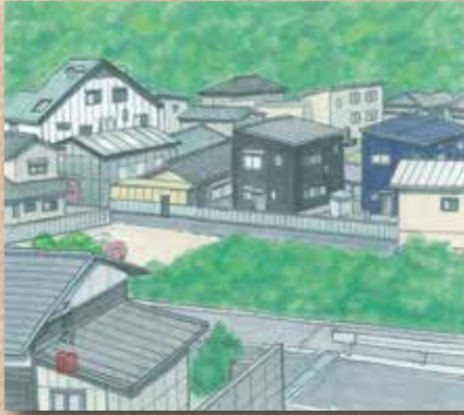
横防 岡崎 貢さんの作品 「横防内浜の景」