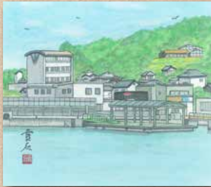
横防 岡崎 貢さんの作品 「小型船の発着桟橋」