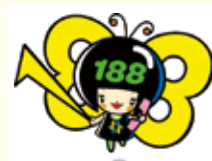
消費者庁 消費者ホットライン188 イメージキャラクター「いややん」

困ったときは、一人で抱え込まないで「消費者ホットライン「いやや」（局番なしの188）」までお電話を「泣き寝入りはいやや（188）！」で覚えてね。