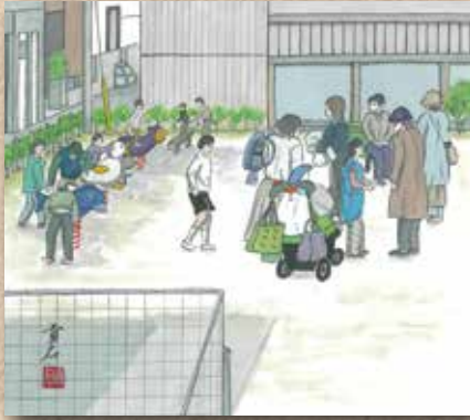
横防 岡崎 貢さんの作品 「ふれあい診療所前の公園」