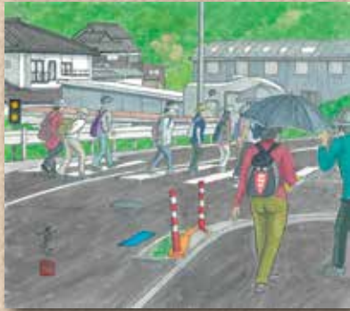
横防 岡崎 貢さんの作品 「宮本石油の角～福祉センター方面に向って～」