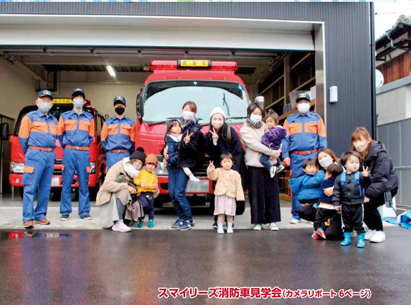
スマイリース消防車見学会(カメラレポート6ページ)

町の人口 | 3月1日現在(先月比) 世帯数/1,543(-5) 人口/2,940(-9) 男/1,520(-8) 女/1,420(-1) 住民基本台帳法の一部を改正する法律により、人口は、外国人の方を含めた人数となっています。