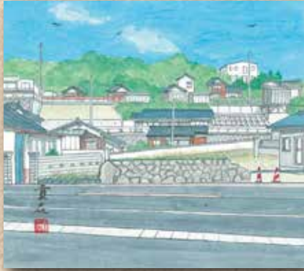
横防 岡崎 貢さんの作品 「家の前の道路工事」