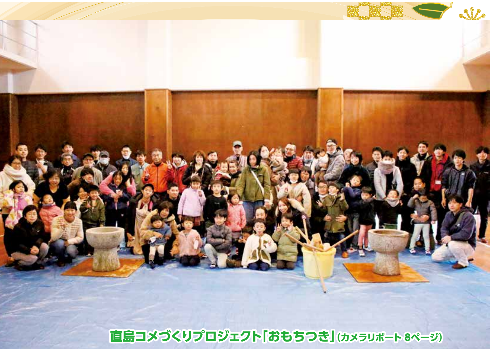
直島コメづくりプロジェクト「おもちつき」(カメラリポート8ページ)

町の人口 | 1月1日現在(先月比) 世帯数/1,546(-15) 人口/2,953(-17) 男/1,529(-13) 女/1,424(-4) 住民基本台帳法の一部を改正する法律により、人口は、外国人の方を含めた人数となっています。