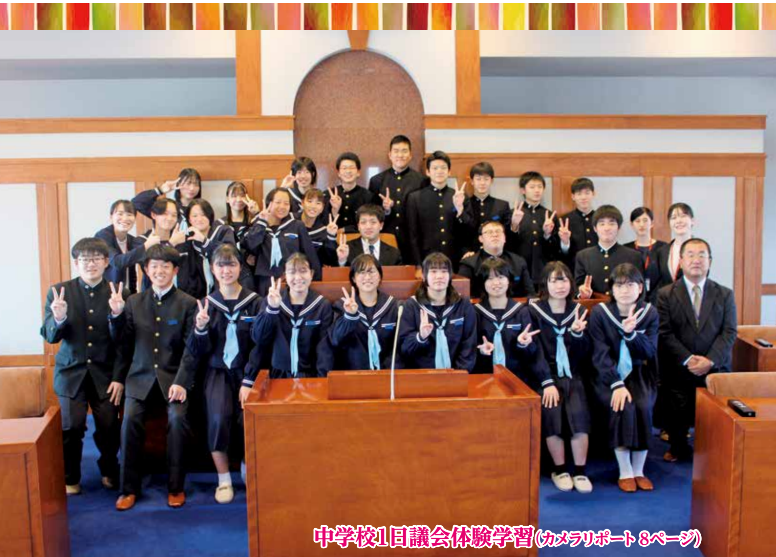
中学校1日議会体験学習(カメラリポート8ページ)

町の人口 | 12月1日現在(先月比) 世帯数/1,572(-1) 人口/2,949(-1) 男/1,524(+1) 女/1,425(-2) 住民基本台帳法の一部を改正する法律により、人口は、外国人の方を含めた人数となっています。