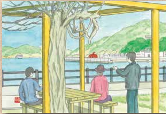
横防 岡崎 貢さんの作品 「横防公園の藤の樹」