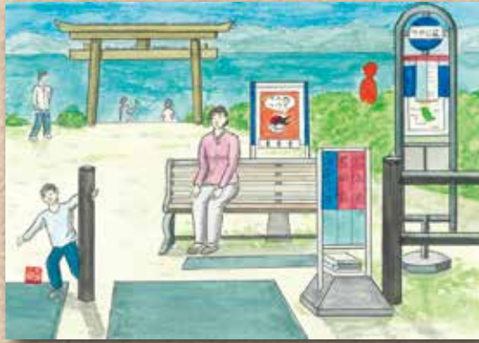
横防 岡崎 貢さんの作品 「バスを待っています。」