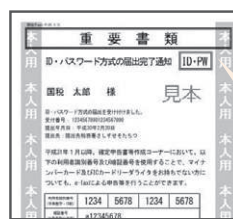
「ID・パスワード方式の届出完了通知」イメージ