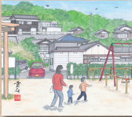
横防 岡崎 貢さんの作品 「曾孫が遊びに来た(横防公園)」