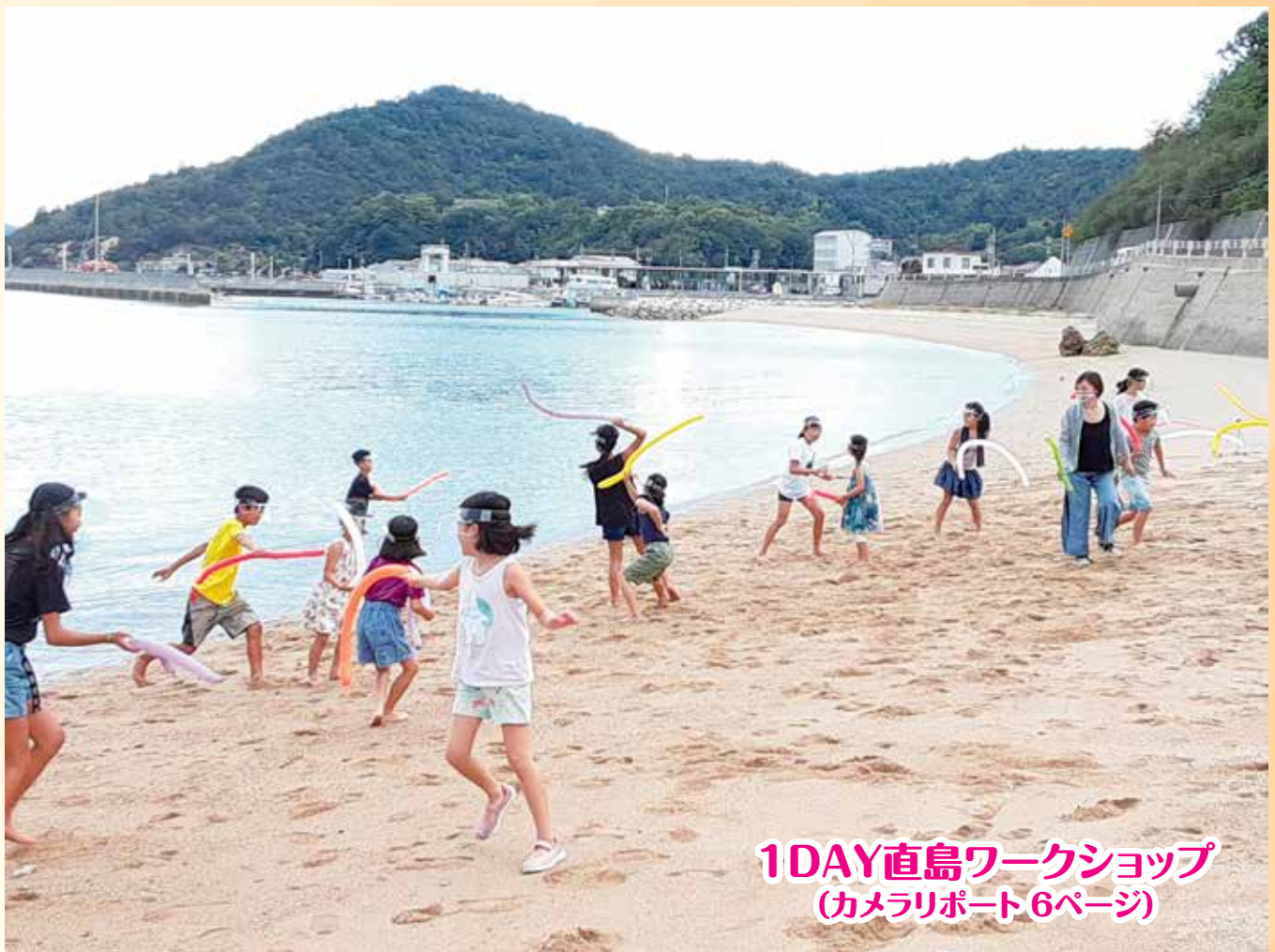
1DAY直島ワークショップ (カメラリポート6ページ)