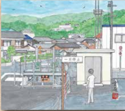
横防 岡崎 貢さんの作品 「排水ポンプ室完成」