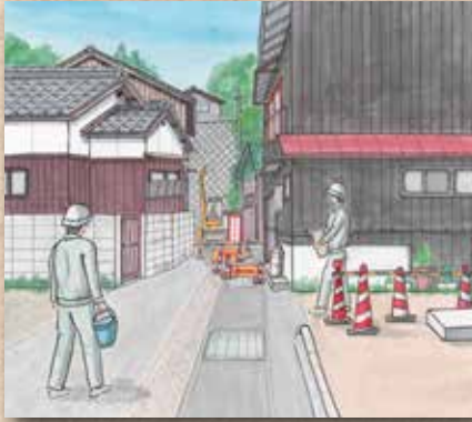
横防 岡崎 貢さんの作品 「住吉神社裏道の工事」