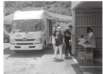
移動図書館（ララ号 西部公民館駐車場・役場倉庫前）

なお、今年度の今後の来島予定は、11/27・12/21・1/29・2/26・3/31です。