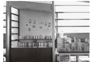
香川県立図書館（役場ロビー）

役場ロビーの巡回文庫約300冊は3カ月に1度（3・6・9・12月）入れ替わっており、役場が開いている時間帯（土日も含め8：15～17：00）ならいつでも利用することができます。