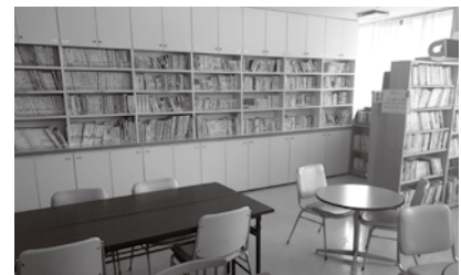
西部公民館図書室（2階）