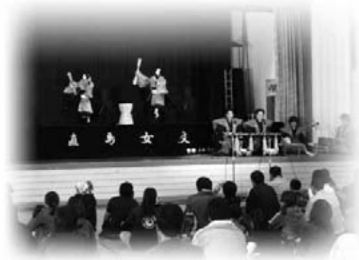
町内外で精力的に公演活動