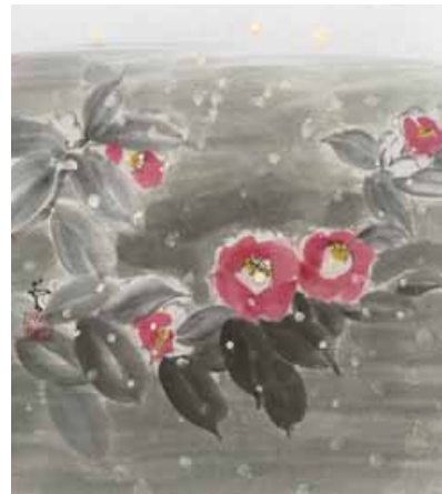
本村 山口愛子さんの作品「雪椿」