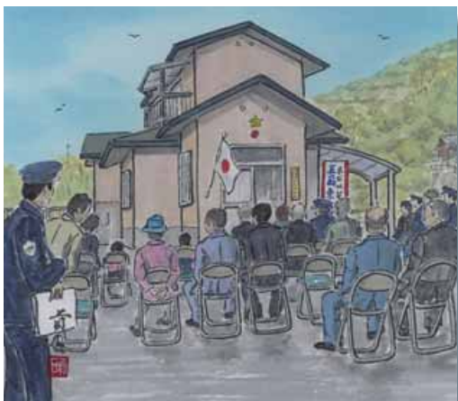
横防 岡崎 貢さんの作品「東駐在所開所式」