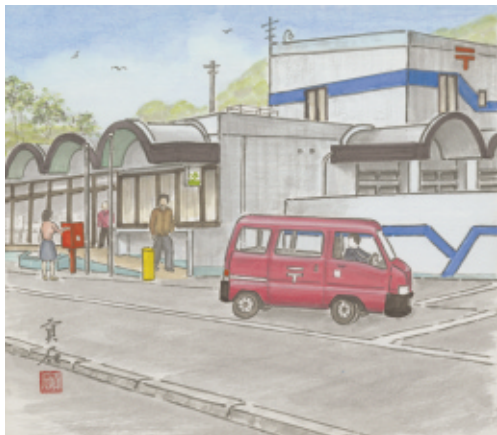
横防 岡崎 貢さんの作品「ポストのある風景」