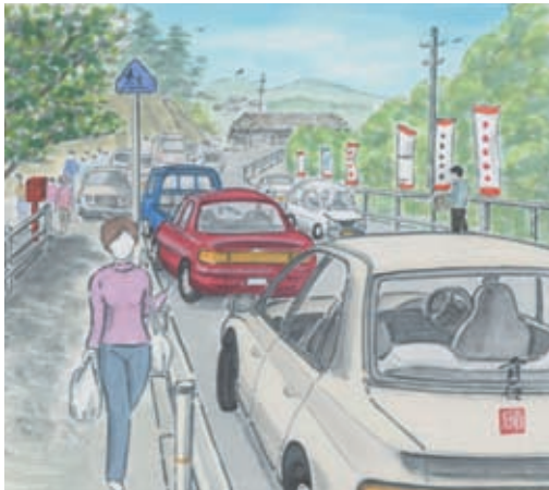
横防 岡崎 貢さんの作品「ポストのある風景」