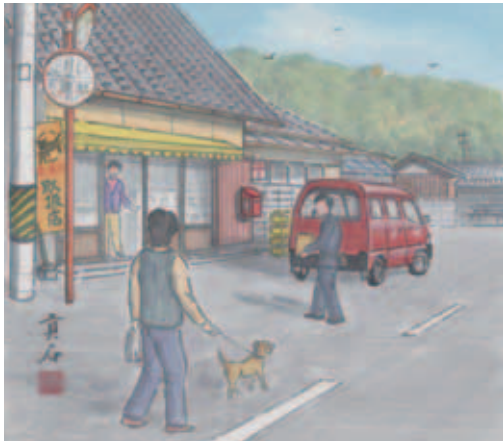
横防 岡崎 貢さんの作品「ポストのある風景」