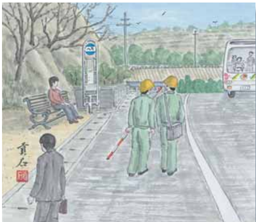
横防 岡崎 貢さんの作品「ヘキ・バス停」