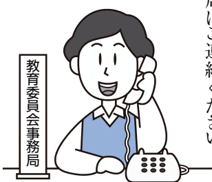
教育委員会事務局

なお、教育委員会に関することでお聞きになりたいこと、ご相談などがありましたらいつでもお気軽に教育委員会事務局にご連絡ください。