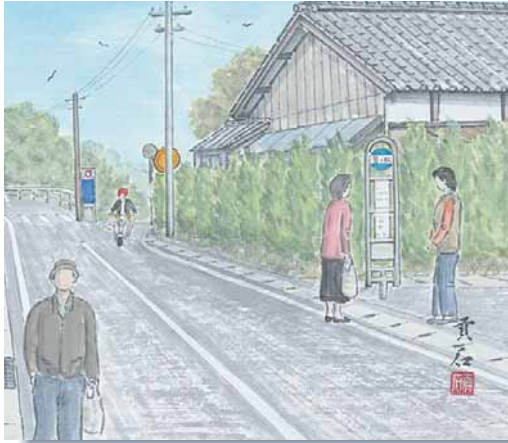
横防 岡崎 貢さんの作品「鷲ノ松バス停」