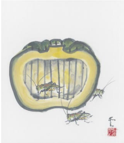
本村 山口愛子さんの作品