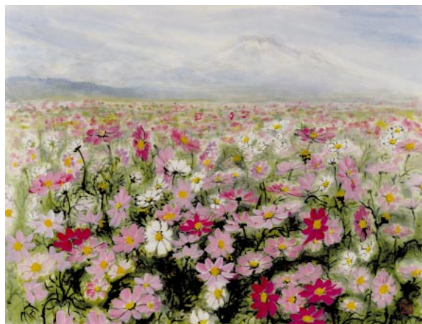
本村 山口愛子さんの作品「コスモス」