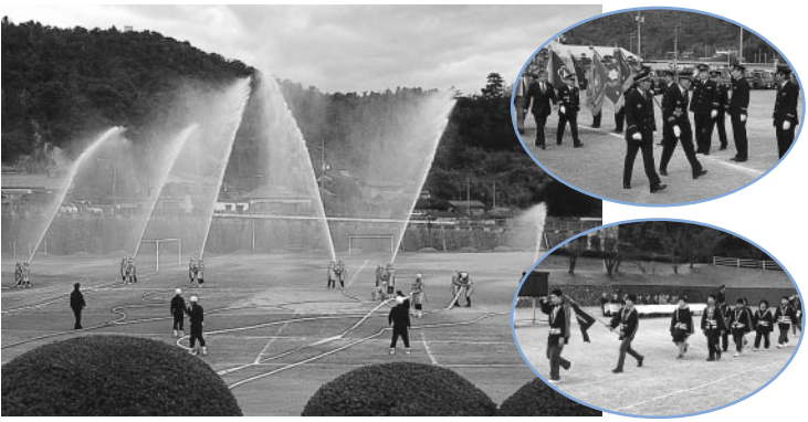
(平成16年出初式表彰者名簿)

1月13日(火)未明に発生しました、山林火災では、直島町消防団をはじめ玉野市消防本部、高松市消防局他各消防本部などの不眠不休の消火活動により19日(月)に鎮火することができました。ありがとうございました。