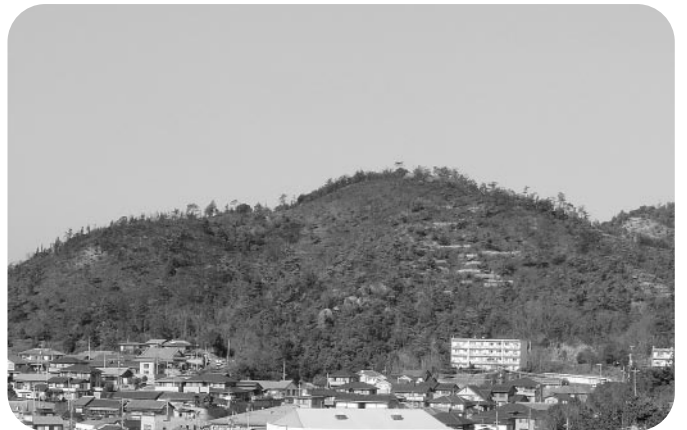
火災後の出火現場付近

なお、他にも多数のかたからお見舞いをいただいておりますが、紙面の都合で次回紹介させていただきますのでご了承ください。