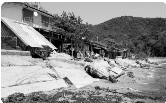
台風16号で半壊状態になった家屋（横防）