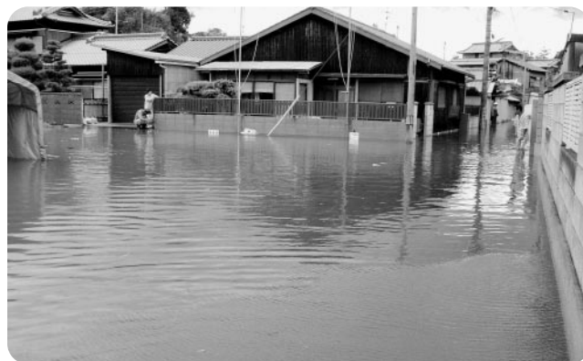
台風18号による高潮（石場町）