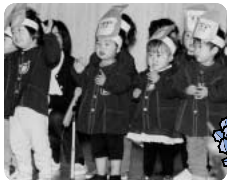
お父さん・お母さんの前で歌をうたう園児たち

12月15日(金) 幼稚園でクリスマス会が行われました。今年は、イルミネーションの点灯に合わせて、午後3時から行われ、クリスマス会が終わって外を覗くとクリスマスムードいっぱいなの光のファンタジーに子どもたちは魅せられていました。