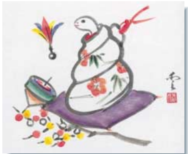
本 村 山口愛子さんの作品