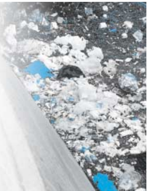
外ヶ浜のごみの不法投棄現場