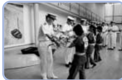
レセプションで花束を渡す子どもたち