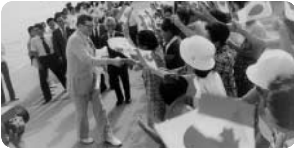
当時、ピクターMパワー市長 来町の様子