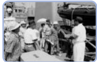
艇の説明を受ける見学者