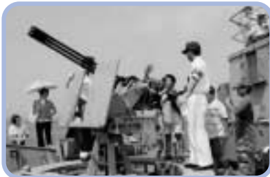
20mm機関砲に人気集中