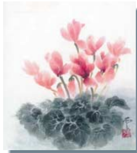
本 村 山口愛子さんの作品