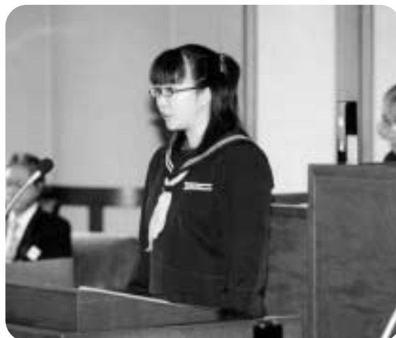
一般質問する参加者

11月30日(金)、町議会議場で、一日議会体験学習が行われ14人の中学生議員が質問にたちました。