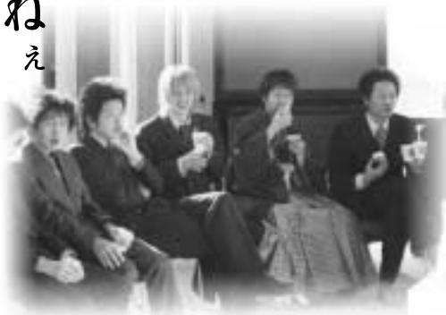
茶話会での一場面

今年の成人式では、出席した新成人が順番に近況報告や将来の目標をみんなの前で報告しました。参加者の中には、結婚して一児の母になる方もおられ会場からは、祝福の拍手がとびでていました。式典後は、会場を変えて茶話会で楽しみ、久しぶりに再会する恩師の先生や同級生と話が盛り上がっていました。