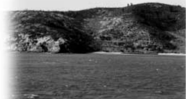
(共創の森づくりが行われる荒神島)