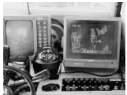
（レーダーやGPSを登載）

この新しいスクールボートは、高速運航時にも揺れが少なく、今まで以上に子どもたちを安全に運ぶことができます。