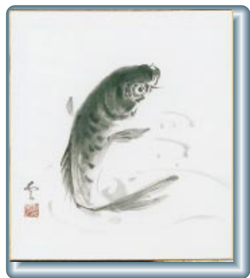
本村 山口愛子さんの作品

診察時間は、午前9時から午後5時まで 休日当番医は都合により変更することがあります。 問い合わせ先：玉野市医師会 ☎(0863) ☎21-3953