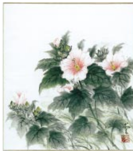
本村 山口愛子さんの作品