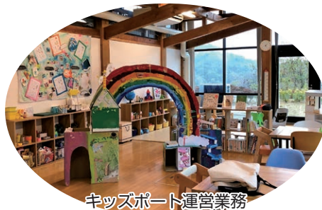
キッズスポーツ運営業務