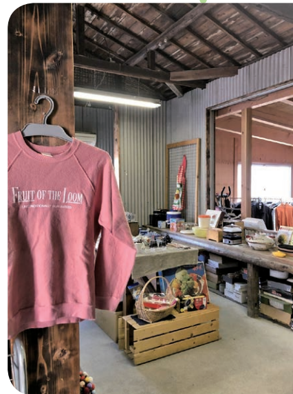
いろいろな物があふれています

が人気ですか。 広 食器や雑貨が人気です。 Q 今までやってこられて良かったことや、困ったことなどありますか。 田 町民だけでなく、世界中の人と交流できたことが楽しかったです。 広 良かったことはたくさんありますが、私も一番はお客さんとの交流ができたことです。 Q 大きい物から小さな物までありますが、何を 田 電気製品やサイズが大きい物等、引き取れない物もありますので、まずは一度お越しください。 Q 町民以外の方でも、持って来たり持って帰ることはできるのですか。 広 町外の方は、持ち込みはできませんが、持ち帰ることはできます。 Q 来られた人に何かお願ひすることはありますか。 田 現在は在庫もたくさんあり、持ち帰りは無料です。気に入った物があれば、ぜひお持ち帰りください。 Q 今後「かえる」とイルカ」がこうなってほしいとの思いは。