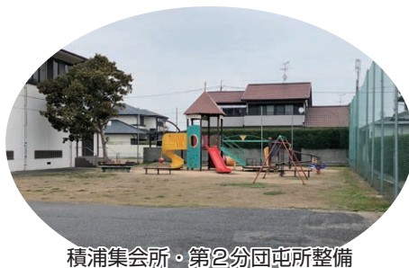
積浦集会所・第2分団屯所整備