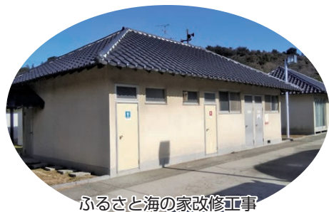
ふるさと海の家改修工事