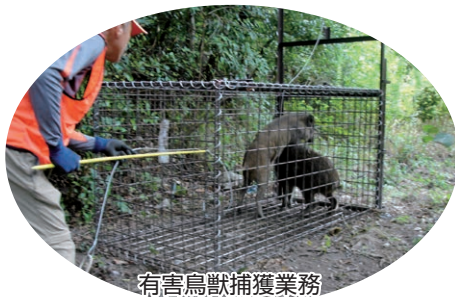
有害鳥獣捕獲業務