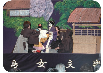
一人でも後継者を