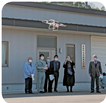
ドローン飛行を視察

条件は厳しく、雨が予想される場合や平均風速5メートルを超えるときは飛行できない。ドローンによる物資輸送には数多くの課題がある