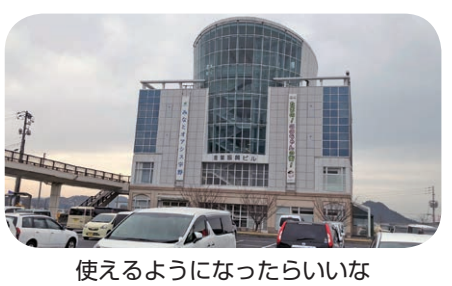
使えるようになったらいいな

待機児童の状況 は。 現在2人が待機 児童となっており ご迷惑をかけているが、 4月からは職員を増員す