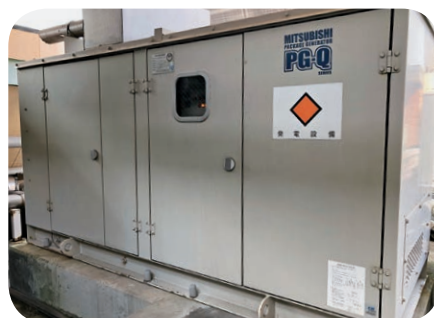
緊急用自家発電機

ブル発電機で対応する。中国電力株式会社と「災害時等における連絡体制及び協力体制に関する協定」を締結している。