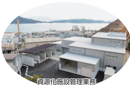
資源化施設管理業務