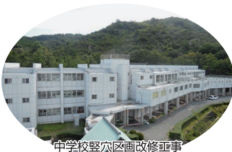
中学校堅穴区画改修工事