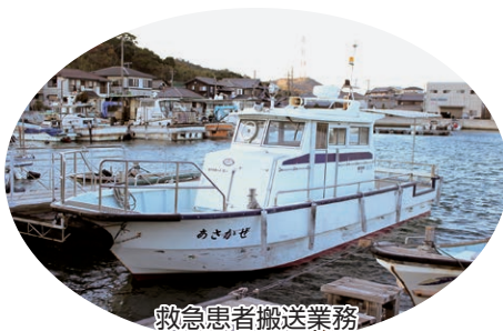
救急患者搬送業務