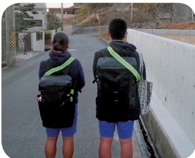
ちゃんと着けるようになった