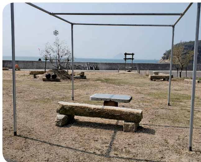
直島塾が整備した横防オリーブ公園 (外ヶ浜)

A (町長) 今のところ助成の要望は一度もない。若い方々が頑張っているので、今後相