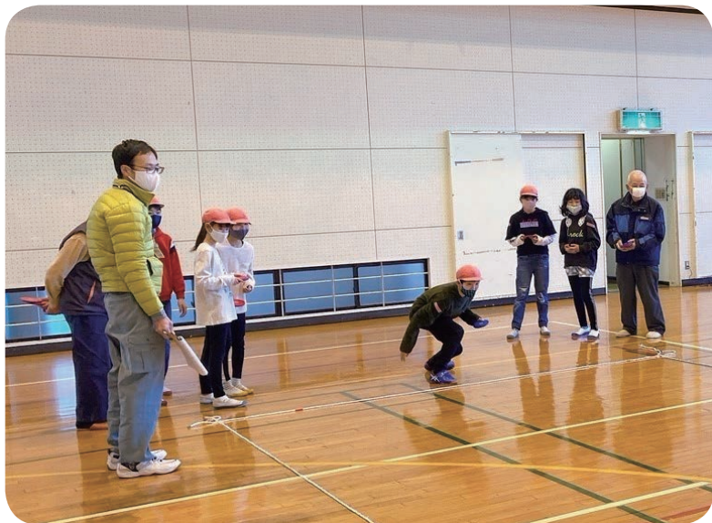
ニュースポーツ、ディスクン